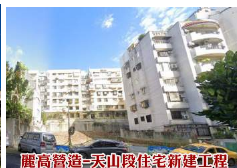
麗高營造-天山段住宅新建工程